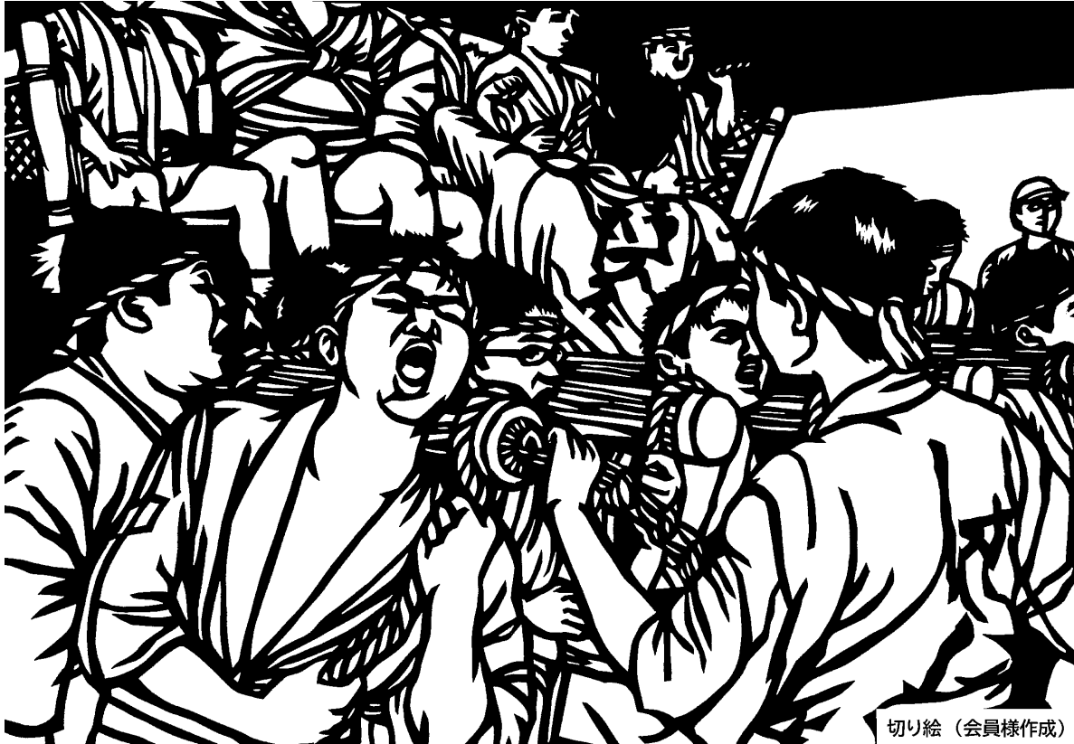
切り絵 (会員様作成)